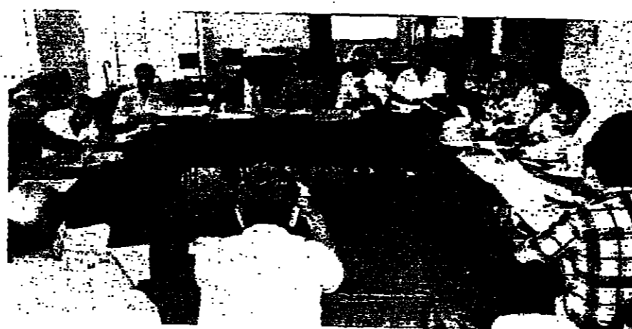
الجلسة التمهيدية خلال اجتماع امس